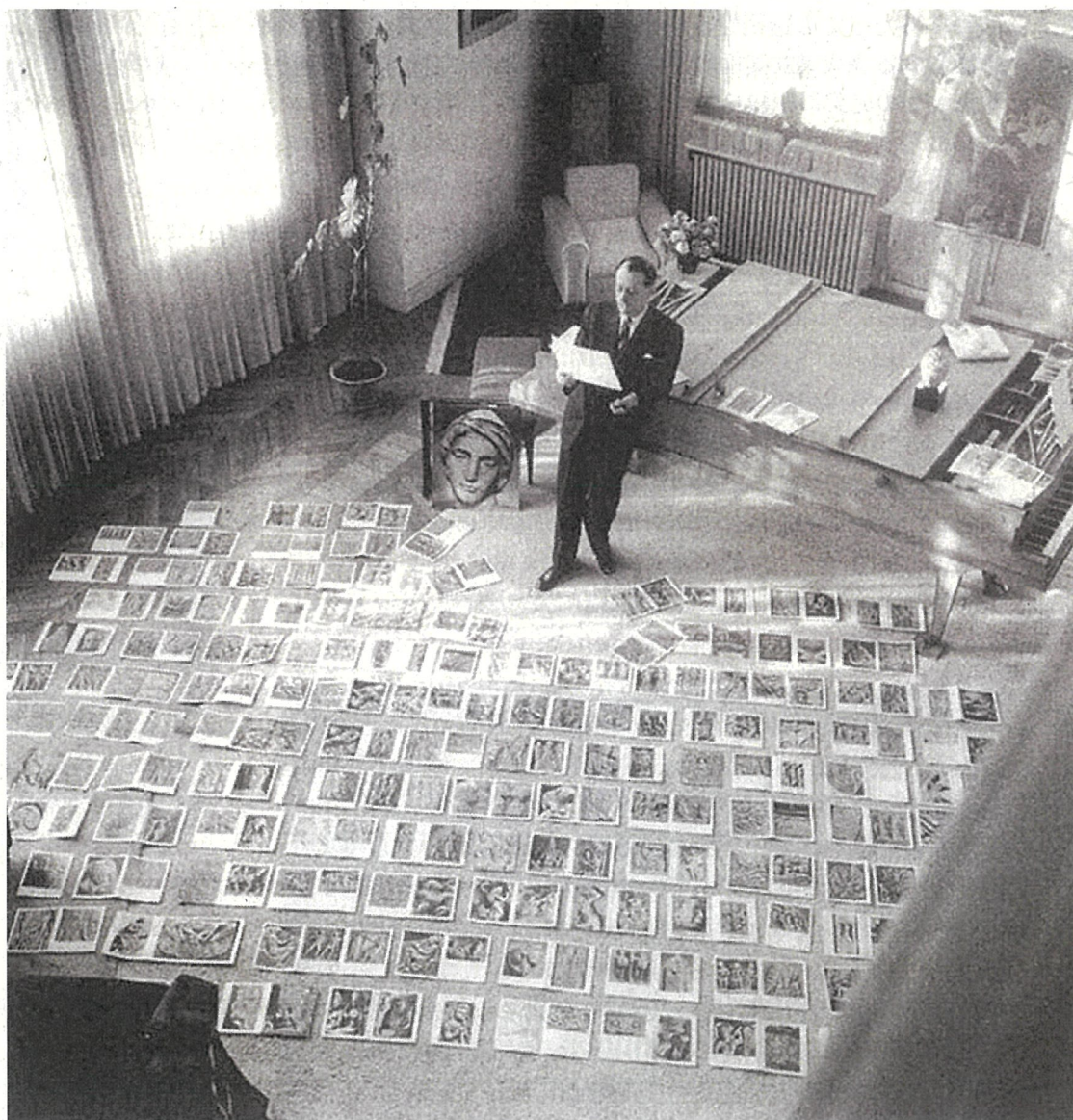
空想美術館のための写真を選ぶアンドレ・マルロー、1954年